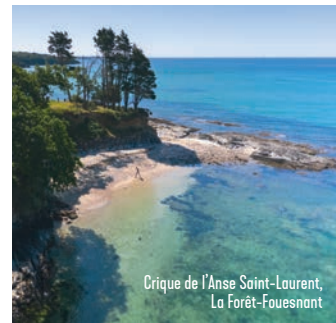
Crique de l'Anse Saint-Laurent, La Forêt-Fouesnant